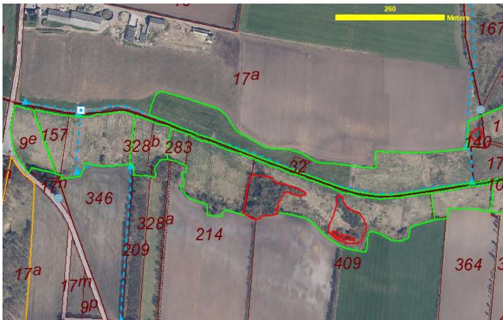
Grænsestiens forløb ved Hjortvad Å. Flyfoto foråret 2019 (COWI).

Stien træder ind i de beskyttede områder i Esbjerg Kommune via en ny bro fra syd. Broen bliver en ca. 10 meter lang og 2 meter bred træbro med gelænder. Broen placeres på øverste vandløbskant, og berører dermed ikke selve vandløbet.