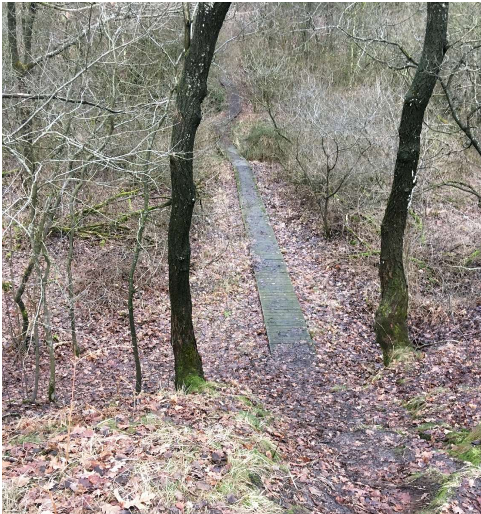
Det nuværende spang gennem moseområdet ved og over Nørå Bæk.

Den øgede skygge under de ca. 1 m ekstra bredde af spangen vurderes altså at kunne udskygge lidt mere vegetation end nu, uden at det dog vil have væsentlig betydning for bestande af planter og planteædende dyr i vandløbet og mosen overordnet, selv om planter og de mulige planteædende vandløbsdyr forsvinder fra denne meget korte strækning.