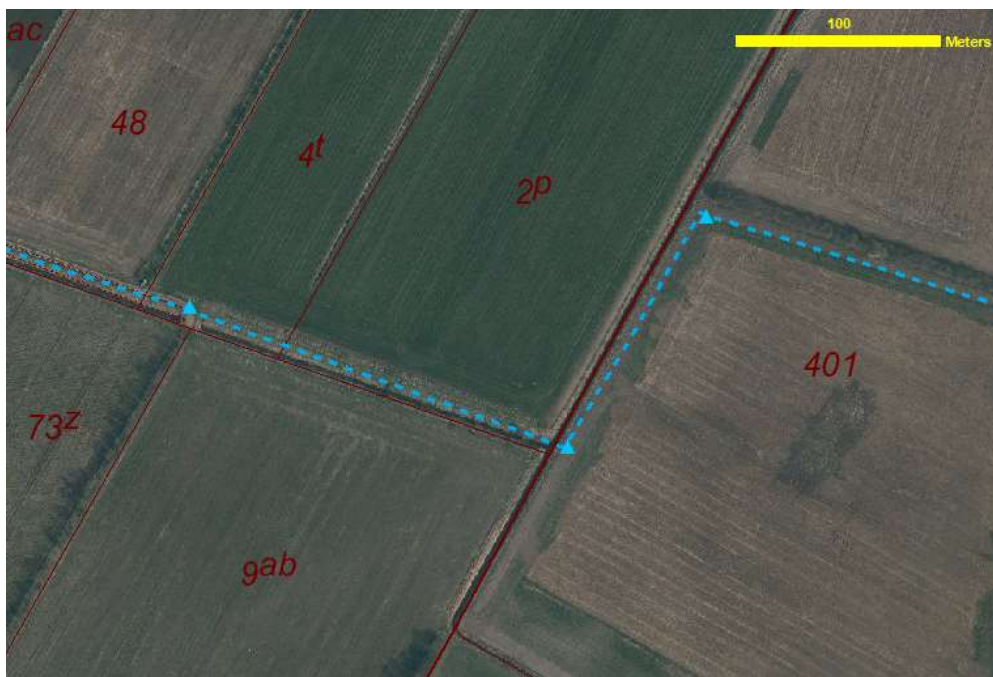
Grænsestiens forløb ved Skovfenne Bæk. Flyfoto foråret 2019 (COWI).

Broen bliver uden gelænder og består af træ støttet på jerndragere, altså nærmest en spang. Den skal fæstes på tørt land og bliver 2 m bred aht. trækning af cykler på stien.